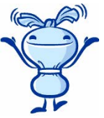
へら星人ミーオ （裏面あり）