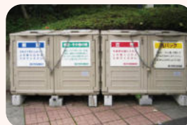
資源回収ボックス

各区の資源循環局事務所(裏表紙)、または資源循環局ホームページで確認してください。