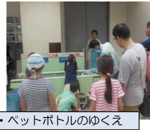
缶・ペットボトルのゆくえ