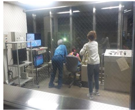
ごみクレーン疑似操作体験