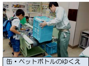
缶・ペットボトルのゆくえ