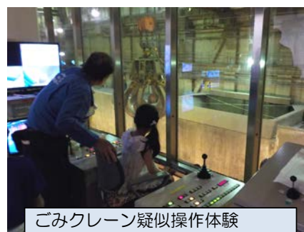
ごみクレーン疑似操作体験