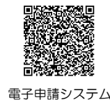
電子申請システム