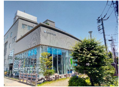
株式会社ビルド 菊名ウォータープラザ