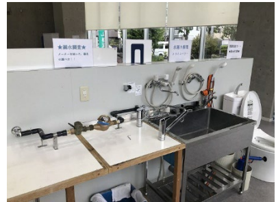
自分で修理をする「トライコーナー」