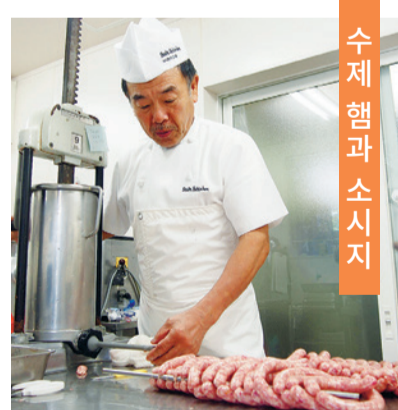
수제 햄과 소시지

【닛타 케이코 마이스터】 미용실 웰 카오리(Well Kaori) 소테츠 이즈미츄점 (이즈미구 · 이즈미츄 소테츠 라이프 상점회)