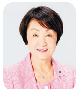
요코하마 시장 하야시 후미코

미나토 미라이 21 지구에서는 올봄의 카나가와 대학 신캠퍼스 오픈, 로프웨이 운행 개시 등 새로운 활기가 생깁니다. '가든 네클리스 요코하마'를 봄과 가을에 개최하여 꽃과 녹음을 즐기는 기운을 2027년의 국제 원예 박람회로 연결시키며, '도쿄 2020 올림픽·패럴림픽'과 'Dance Dance Dance@YOKOHAMA 2021(가칭)'의 준비도 진행합니다. 칸나이·칸가이 지구의 거리 조성 및 교외부 활성화에도 힘을 쏟겠습니다. 또한 미래의 경제 성장을 뒷받침할 국가적 프로젝트인 IR(통합형 리조트)의 실현을 위한 대처와 새로운 극장 정비의 검토를 진행하여 매력 넘치는 도시 만들기 및 요코하마의 지속적인 발전을 위한 길을 터 나가겠습니다.