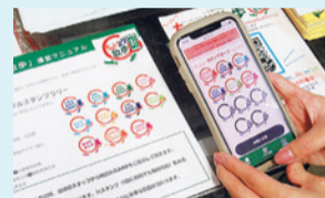
모바일 스탬프 랠리 (2020년 12월 개최) ▶

‘코호쿠의 상점가 초이요리 산포’ (코호쿠구 · 코호쿠구 상점가 연합회)