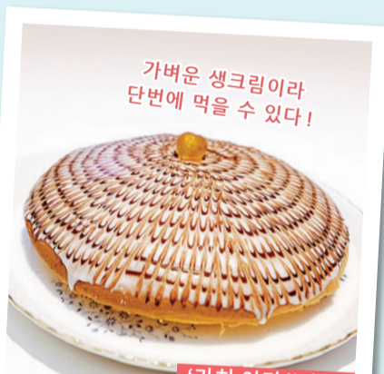
가벼운 생크림이라 단번에 먹을 수 있다!

【마메 다이후쿠】 화과자점 요코하마 베니아 (카나자와구 · 토미오카 쇼와카이)