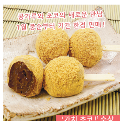
콩가루와 초코의 새로운 만남 1월 중순부터 기간 한정 판매!