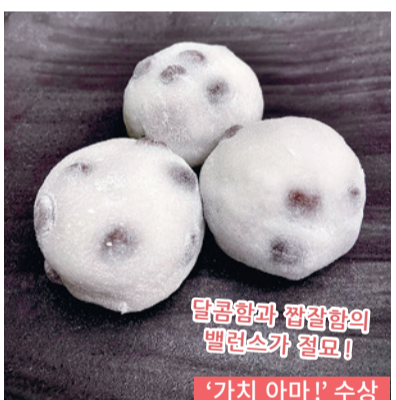
달콤함과 짭짤함의 밸런스가 절묘! ‘가치 아마!’ 수상

요코하마의 상점가에서 사랑받고 있는 일품('가치!' 시리즈 수상 제품)과 상점주로서 시민의 생활을 뒷받침하고 있는 '요코하마 마이스터'를 소개합니다. 마음에 드는 일품과 달인의 기술을 근처 상점가에서 발견해 보십시오.