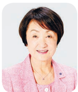
横滨市长 林 文子

横滨市在疫情中,领先世界举办了国际现代艺术展「横滨三年展2020」。此外,到访「秋季里山花园节」,观看横滨秋季盛开花卉的人数破历史记录。如今,正在实施「霓虹横滨-yorunoyo」活动,