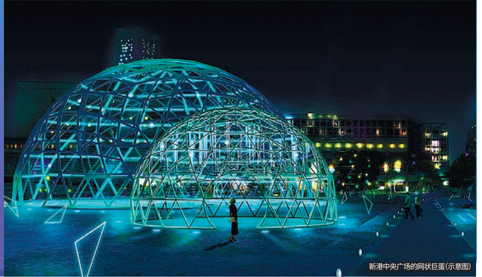
新港中央广场的网状巨蛋(示意图)