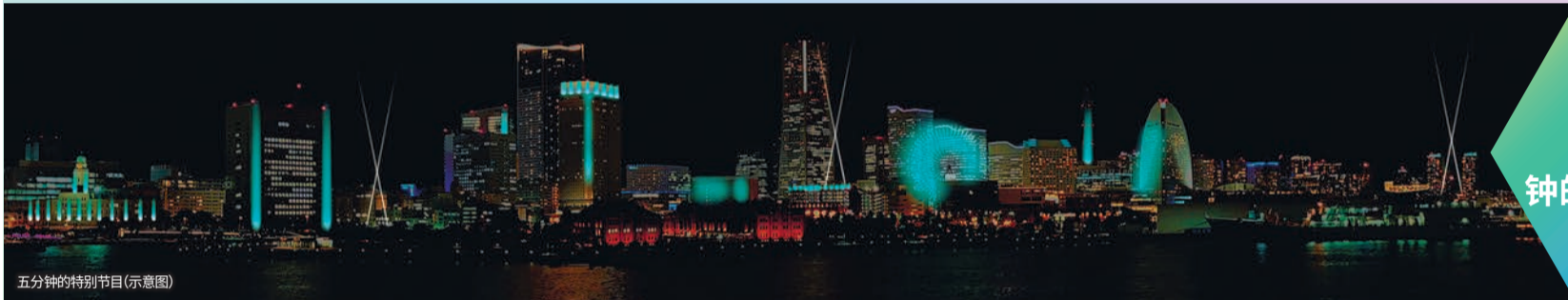
五分钟的特别节目(示意图)

在港未来21地区,可以充分享受体现了横滨特色,以「人、物、文化交织」为主题布置的霓虹灯展。当人们漫步在广场的树丛间,即可编织出美丽的灯光流线。并且,进入直径达10米和20米的网状巨蛋中,可以感受到光芒四射五彩缤纷。