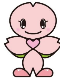
南区マスコットキャラクター みなっち