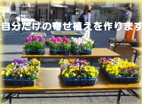
自分だけの寄せ植えを作ります