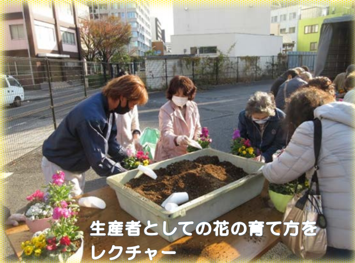
生産者としての花の育て方を レクチャー