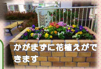
かがまずに花植えがで きます

お願い 今回愛護会長様宛に、 別郵便 で、「公園愛護会現況届、会長変更」・「口座振替払依頼書」・「物品届先確認書」をお送りします。