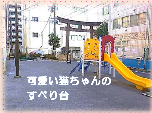
可愛い猫ちゃんの すべり台

日ノ出町『子神社』わきにある、 子の前公園 の改良工事が、行われました。小さなお子さんにも遊んでもらえるような複合遊具と大人のかたに利用していただきたい、健康器具を新たに設置しました。