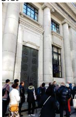
歴史的建造物の説明を聞きながら新市庁舎工事現場へ移動