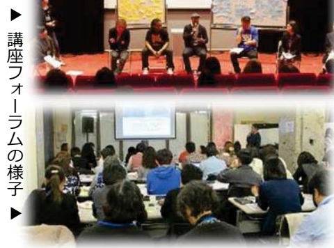
▶ 講座フォーラムの様子

訂正：65 号に掲載した「横浜歴史研究会」の記事に誤りがありました。お詫びして訂正します。