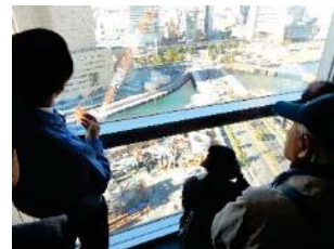
アイランドタワービル17Fから工事現場の見学と説明を聞く