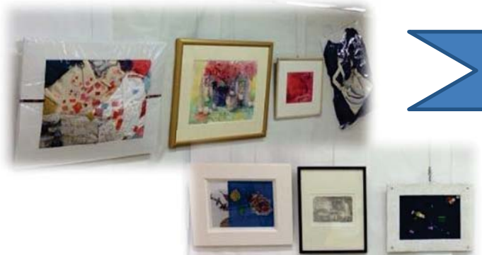
12 月の展示「リリの会」作品展

展示コーナーで作品や活動紹介を披露してくださる団体を募集しています。メンバー募集にもご活用ください。★展示希望の登録団体はセンターへ