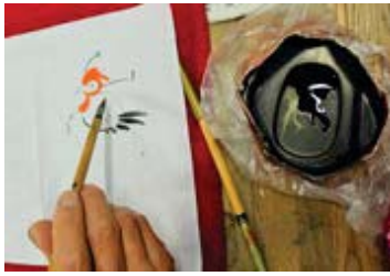
【写真】詩吟の歌にあわせて剣舞の披露（左）、来年の干支の絵を描く書芸（上）、チームさくらによる音楽朗読劇「かぐや姫」