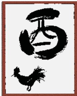
なか区民活動センター マスコット もなか

中区内の生涯学習・市民活動の参加を夢見て、様々な活動をされている人たちのための情報誌であり、多くの夢が生まれ皆に親しまれますようにと名づけられました。