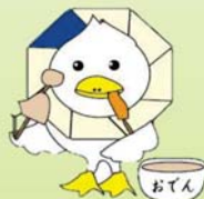
前回の活動ガイド