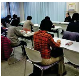
【写真】音読の方法を学んで、記憶力アップ講座(上)・コグニサイズで頭と体を同時に使って認知症予防講座(右)・手品に挑戦講座(右端)