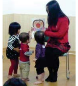
中国語で「いないいないばああそび」。こどもたちは大喜び! (上) 参加したこども達より保護者の方々の方が熱心な様子。(左)