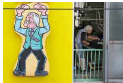
「看板息子」 by Miho Hirose©2014

HP： http://www004.upp.so-net.ne.jp/norikojima/