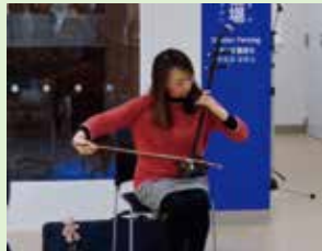
ゲストの二胡演奏