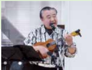
「街の先生」による演奏

センターが1年8か月ぶりに元の場所に戻り、装い新たにオープンしました。壁も窓も床も新しく、研修室も広くなり、使い勝手がよくなりました。皆さん、どんどん利用してください！同じフロアに、なんと、「ナカナ・カフェ」が入っていますよ！