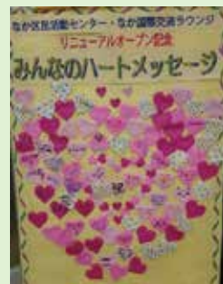
みんなでハートメッセージ作り