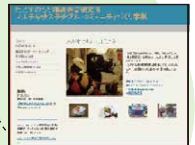
（作成したホームページの一例）