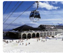
バルコール嬭恋スキーリゾート

毎年9月に「キャベツ畑の中心で妻に愛を叫ぶ」(キャベチュー(略称))がここで開催されます。キャベツ畑に囲まれた「愛妻の丘」で、夫が妻へまた自分の大切な人に日頃の感謝や愛の言葉を伝える、嬭恋の風物詩です。