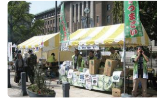
中区民まつり 「ハローよこはま」での嬭恋村出展