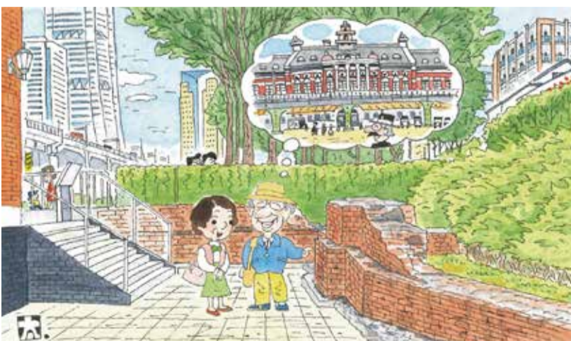
題字・絵・文…鈴木太郎(西区文化協会)