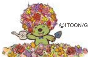
横浜の花と緑をPRするマスコットキャラクター 「ガーデンベア」

開催期間：(春)2025年3月19日(水)～5月6日(火・休) (秋)2025年9月中旬～10月中旬 開催場所：旭区上白根町1425-4 (よこはま動物園ズーラシア隣接)