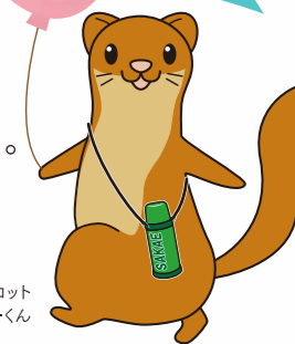
栄区いち川マスコット タッチーくん

栄区には、花や緑が魅力的な場所がいっぱい! その一部を紹介するよ。みなさん、是非いろいろ巡ってね。