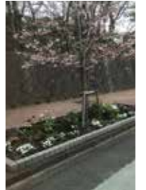
▲ゆうも緑道沿い花壇

バラのみでなく、四季折々の花を愛でながら庭でお茶を楽しむような庭づくりを心掛けています。