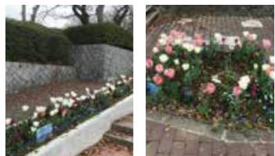
▲階段スロープ沿い花壇 ▲公田サッカーガーデン