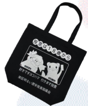
← 配布したエコバッグ