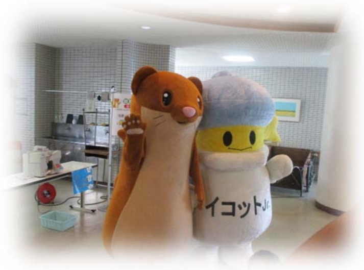
↑ イコット Jr. とタッチーくんの夢のコラボ