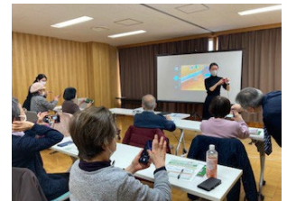
高齢者のICT利活用支援