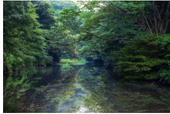
豊かな自然を体感できる森