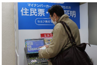
住民票等交付のセルフ手続

▶マイナンバーカードの普及やデジタル化への関心が高まる中で、マイナンバーカードを活用した手続きに慣れていただくきっかけづくりや、安全・安心・快適に配慮した庁舎環境の実現など、区民の皆様に寄り添った行政サービスを提供します。