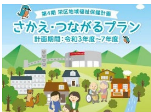
さかえ・つながるプラン

▶区民の皆さまや関係機関と連携し、誰もが安心して自分らしく健やかに暮らせるまちづくりを進めます。