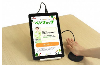
野菜摂取量を推定できる機器