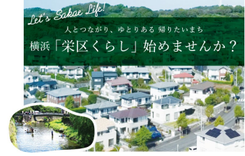
郊外住宅地PRの取組