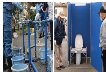
地域防災拠点の訓練