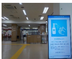
快適なエントランス