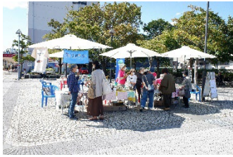
本郷台駅前広場の活用

▶開放的な駅前空間、森と川が一体となった豊かな自然、ゆとりある住環境などの栄区の特徴を活かし、にぎわいのあるまちづくりに取り組みます。