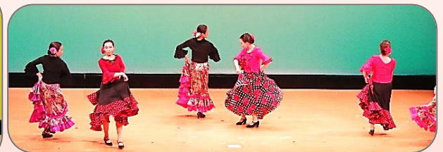
輝く！せや！ひと！フェスタ3に出演