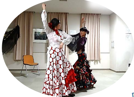
「素足のフラメンコ」