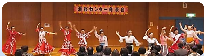
瀬谷センター祭りに出演

「乾杯！」とグラスを合わせるように、その場にいる方達と空気を共有し、心通わせるような踊りが私達も出来るように技も表現力も磨いて行きたいです♡