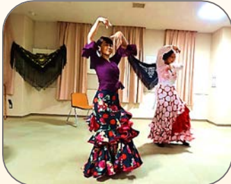
今宿地区センターロビーコンサートに出演

長い歴史の中で歌われてきた悲しみや喜び、その前では裸の自分になっていいと、フラメンコの歌がそっと包んでくれます。また、場を共有することによって相互交流も生まれます。