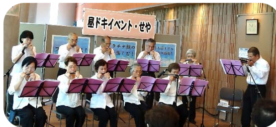
「ハーモニカ友の会」