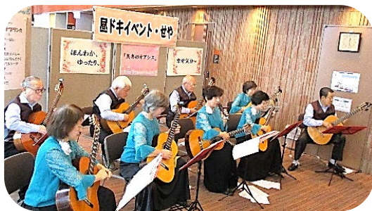
「ギター・カサフランカ」