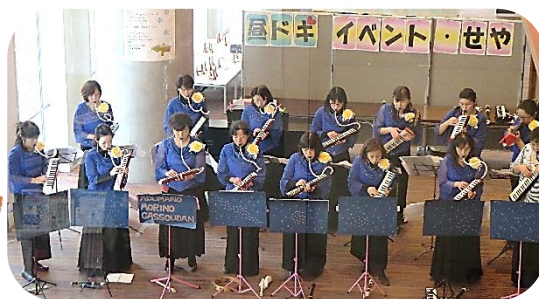
「あづまのの森の音楽隊」