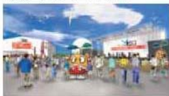
①Y150はじまりの森 (新港地区8街区)