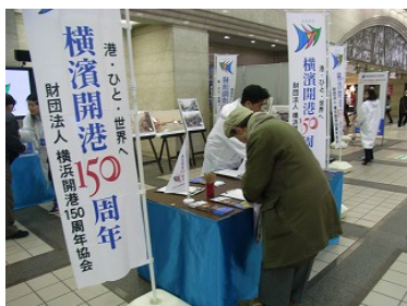
■街頭キャンペーン(市内8か所11回)