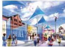
④赤レンガ会場（広場）