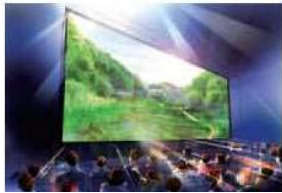
③Y150ドリームフロント (新港ふ頭)