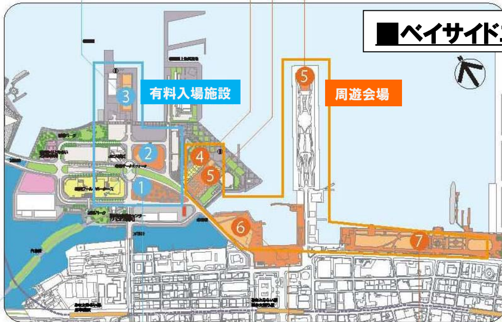
②Y150トゥモロパーク (新港地区7街区)