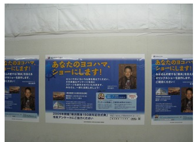
■ポスター 横浜駅みなみ通路