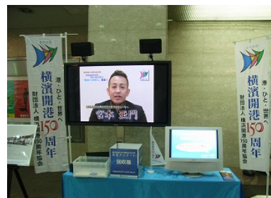
■キャンペーンセット