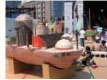
⑤大さん橋会場・赤レンガ会場（1号館）