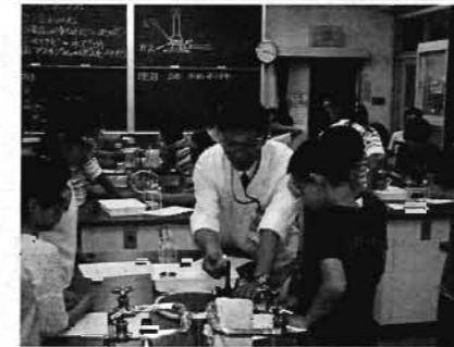
中学校理科室で中学校教諭による6年の理科の授業