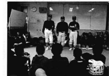
中学生による小学6年生への部活動紹介