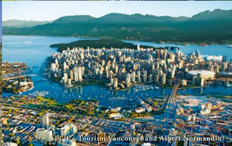
バンクーバー バンクーバー市内