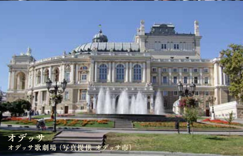
オデッサ オデッサ歌劇場