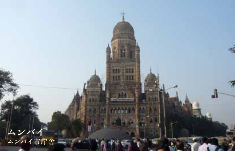
ムンバイ ムンバイ市庁舎