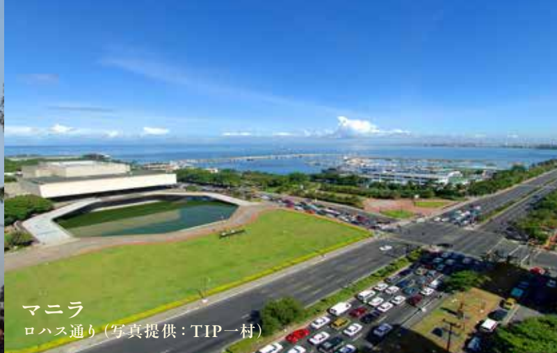
マニラ ロハス通り