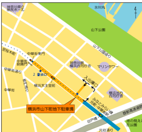
山下町地下駐車場