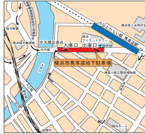
馬車道地下駐車場