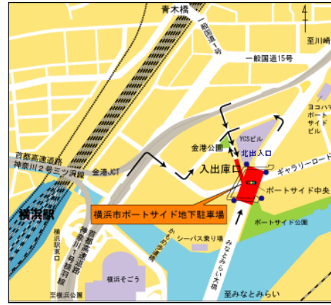
ポートサイド地下駐車場