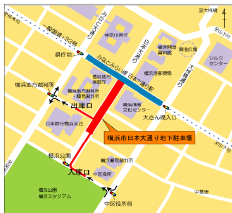
日本大通り地下駐車場