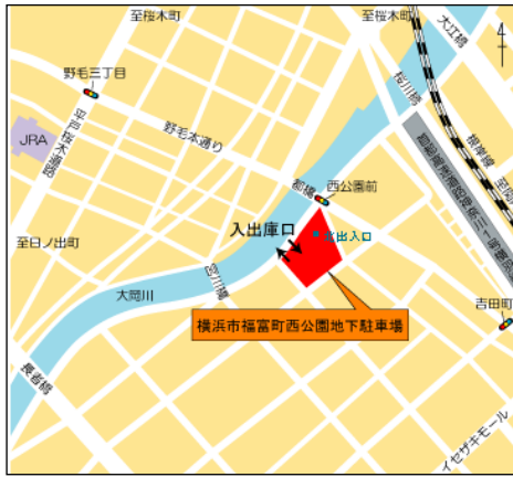
福富町西公園地下駐車場