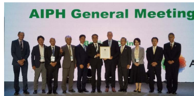
AIPH 開催承認の様子（令和元 9 月 AIPH 総会）

引き続き、市民の皆様や関係者からの御意見をいただきながら、国や経済界とも連携し、取組を進めます。