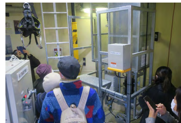
秋の風力発電所見学会(令和5年11月26日)