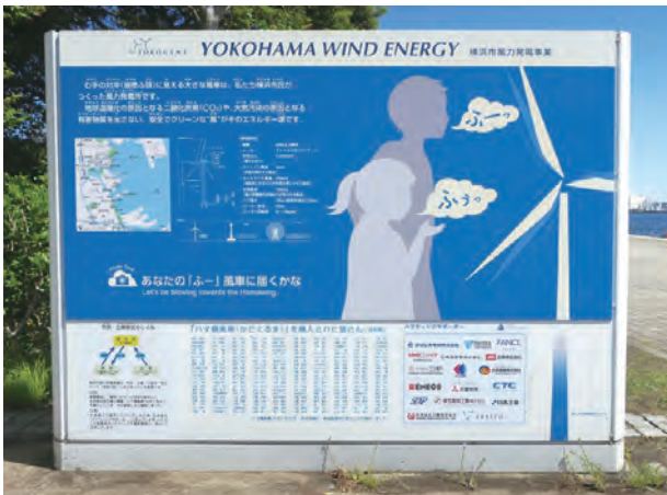
臨港パークにある啓発表示板

※みなとみらい線 みなとみらい駅 徒歩5分 JR線・市営地下鉄 桜木町駅 徒歩15分