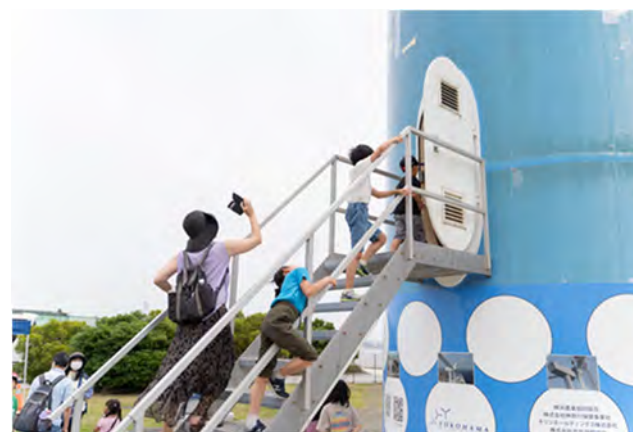
親子風力発電所見学会(令和5年6月18日)