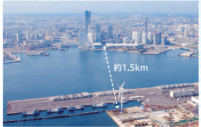
神奈川区鈴繁町(瑞穂ふ頭)の所在地