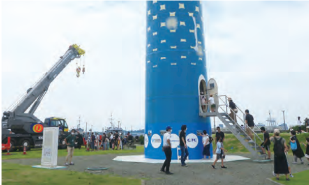
親子風力発電所見学会の様子

※グローバルウィンドデー(Global Wind Day)とは、GWEC(世界風力エネルギー会議)が毎年6月15日を中心に世界各国で実施している風力発電の啓発イベントです。