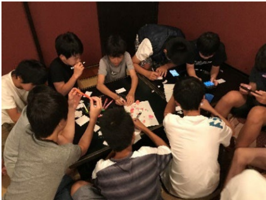
子どもを交えたワークショップの様子 (イメージ図:地域の会合で実施)

また、保土ケ谷区全域へ取組の輪を広げるため、幅広い世代を対象にプロモーション活動を推進します。