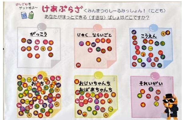
子どもを対象としたシールアンケート 「あなたがほっとできる(好きな)ばしょはどこですか?」 (区民まつりで実施)