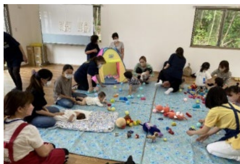
ほがらか育児講座 (子育てサロンおひさま：新井町自治会館)