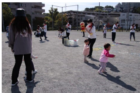
ほがらか広場（星川中央公園）