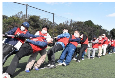
第1回地区対抗綱引き大会

綱引き大会をきっかけに地域で集まり顔の見える関係性を築き、他の活動へ広がっていきます。さらに地域住民の一体感を育むことでまちへの愛着を深めます。