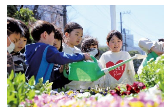
区内小学校での花の育成 (花薫るきれいな街ほどがや事業)