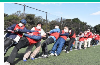
区民まつりでの地区連合対抗 綱引き大会 (区制100周年ブースター事業)