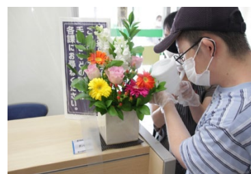
花のおもてなし事業

区内障害福祉事業所にフラワーアレンジメント作製を依頼し、令和5年度は区役所の各窓口など14カ所に展示しました。