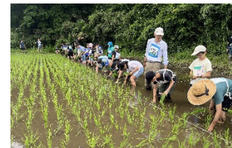
ほどがや☆元気村 (こどもが主役！地域の魅力体験事業)