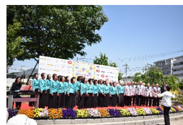
ほどがや花フェスタ 2024

「ほどがや花憲章」の理念を活かしたイベント「ほどがや花フェスタ2024」を5月 18 日に実施。1万8千人の方にご来場いただきました。イベントでは花と緑に関連したブースに加え、脱炭素や、「ヨコハマ プラ5.3 計画」の普及啓発を行いました。