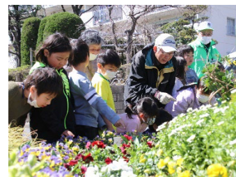
地域ボランティアの皆さんと花壇に水やりをする児童

区民ボランティア(「ほどがやフラワーメイト」)による区庁舎花壇等の植栽管理を実施。(毎月第2、4木曜日)。また、区内幼稚園や保育園、小中学校へ花苗を配布(5月:幼稚園8園 保育園 24 園 小学校8校 中学校3校 計 45)(11月:幼稚園 12 園 保育園 39 園 小学校 12 校 中学校2校 計 65)、児童・地域ボランティアの皆様により育てていただき身近に花がある環境を整えました。