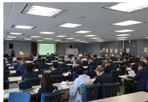
実行委員会(4/26)の様子

約 100 名からなる実行委員会を開催し、100 周年事業の基本的な考え方や組織体制を決定しました。今後区のマスコットキャラクター作成や登録団体の募集などを行っていきます。