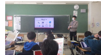
区内小学校4年生を対象した出前授業 (災害対策推進事業)