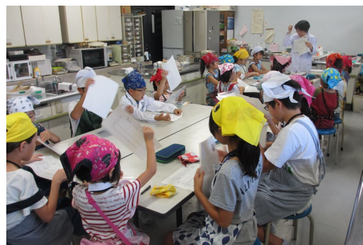
がやっこ教室の様子

田植えや野菜の種まきと収穫、稲刈り、餅つきなど、「どろんこ教室」を年 12 回実施予定です。