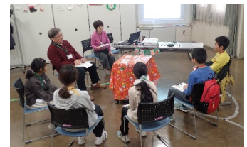
こども向けワークショップ (保土ヶ谷ほっとなまちづくり推進事業)