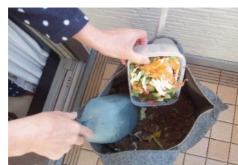
バッグ型コンポストを用いた生ごみの堆肥化

障害事業所等に通う障害のある方が作ったフラワーアレンジメントを区役所の各窓口展示します。(14か所、48回の予定)