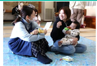
赤ちゃん教室 (ほどがやhappy子育て)