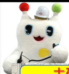
土砂災害 ハザードマップ

ハザードマップは手に入れたんだけど・・・ よく見ても家の場所がわからないんだよね(;'▽')