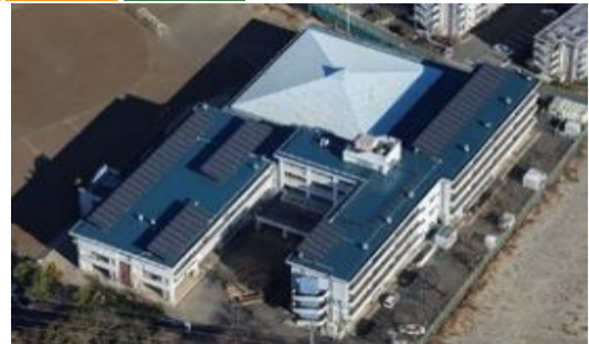
【鎌倉市T小学校屋上太陽光パネル】