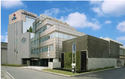
【太陽光・風力発電を備える免震対応型の本社ビル】

「もの」づくりは「人」づくり、「人」づくりは「まち」づくり、「まち」づくりは「夢」づくり