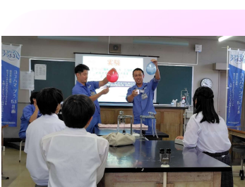
戸塚資源循環局職員による講義 & ゴミの収集体験

ゴミって何だろう? ということに立ち返り、ゴミについて学び、 自分たちで自転車置き場のペンキ塗りによる補修を行いました。