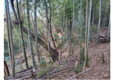
本校敷地内の竹林

舞岡高校は緑と活気あふれる学校です。 しかし、敷地内に竹がたくさんあり、困っていただいた学校です。 今年から「地域貢献委員会」も発足し、部活動や有志、 そして学校内だけでなく、地域や社会とともに 竹の有効利用という課題に取り組んでいます。 また、不要な竹=ゴミ?そもそも「ゴミ」ってなんだろう? ? 根底の課題から「ゴミと資源」についても考えだしています。