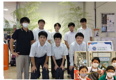
戸塚モディで 七夕・夏祭りイベント