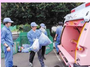
タウンニュース戸塚・泉区版 2024年9月26日