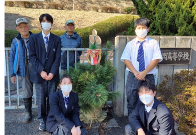
舞岡公園スタッフとともに門松作り