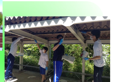
自転車置き場の ペンキ塗り