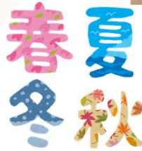
タウンニュース戸塚・泉区版 2022年9月1日