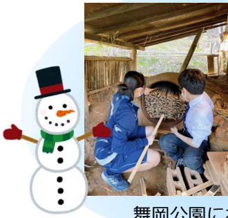
舞岡公園において竹炭作り