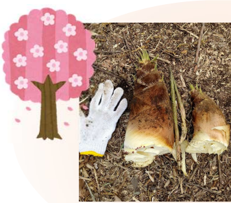
本校竹林での タケノコ掘り

春はタケノコ掘り、夏はイベント、新年は門松、冬は竹炭作り。 PTAや舞岡公園、戸塚モディとともに季節に合わせて活動を行いました。