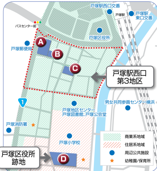
戸塚駅西口市有地の土地の概要

問 都市整備局市街地整備推進課 (☎ 671-3799 fax 664-7694)