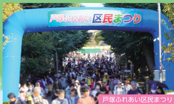
戸塚ふれあい区民まつり

区民が主役の「戸塚ふれあい区民まつり」とすることで、元気ある地域交流の促進、区民の郷土愛を醸成します。