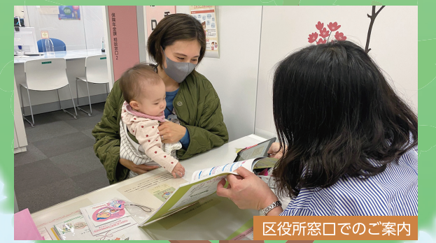
区役所窓口のご案内

区役所混雑情報の提供や、職員の対応マナー向上などにより便利で気持ちよくご利用いただける区役所づくりを進めます。