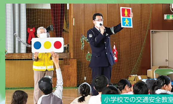
小学校での交通安全教室

地域の防犯活動を支援するとともに、イベントの開催を通じて防犯意識の向上に取り組みます。また、小学校での交通安全教室など交通安全啓発を行います。