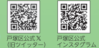
戸塚区公式 X (旧ツイッター) 戸塚区公式 インスタグラム

WEBサイト、SNS、コミュニティFMなどのデジタル媒体や紙媒体を複合的に活用し、分かりやすい情報発信に取り組みます。