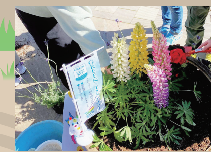
小学校での花植え

2027年国際園芸博覧会「GREEN×EXPO 2027」の成功に向け、区役所一丸となって区民の皆さまに届く広報PRに取り組みます。