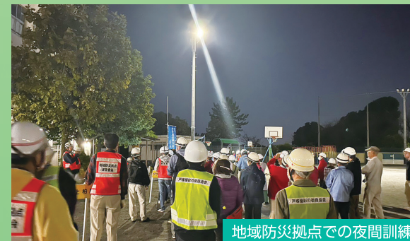
地域防災拠点での夜間訓練

災害を自分事として捉えていただくため、電柱やバス車内で防災情報を発信するとともに、災害時の区本部体制や医療体制強化に取り組みます。