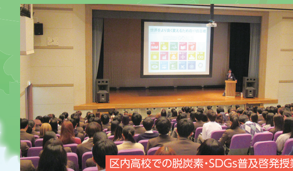
区内高校での脱炭素・SDGs普及啓発授業

花できれいなまちづくりを推進するとともに、さまざまなツールを用いて幅広い層へ脱炭素やSDGsの普及啓発を実施します。