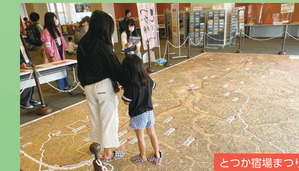
とつか宿場まつり

ストリートライブや音楽交流広場開催による「音楽の街とつか」の魅力発信や、旧東海道戸塚宿を中心とする身近な歴史の紹介を通して、戸塚への愛着を深めます。