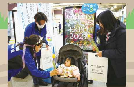
GREEN×EXPO 2027 開催周知イベント