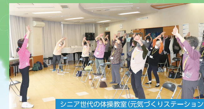
シニア世代の体操教室(元気づくりステーション)

高齢者の方などを地域で見守る取組を進めるとともに、精神保健福祉・メンタルヘルスに関する知識の普及啓発や集いの場を提供します。