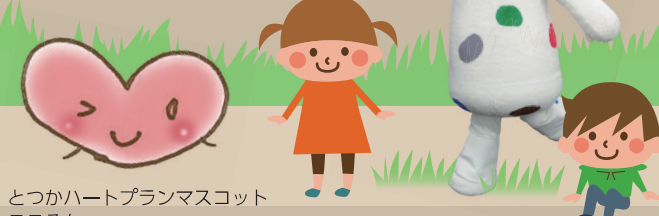
とつかハートプランマスコット こころん

2027年国際園芸博覧会「GREEN×EXPO 2027」の成功に向け、区役所一丸となって区民の皆さまに届く広報PRに取り組みます。