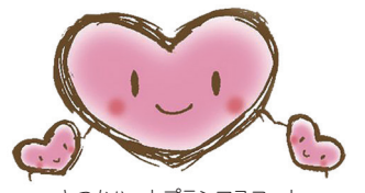
とつかハートプランマスコット「こころん」