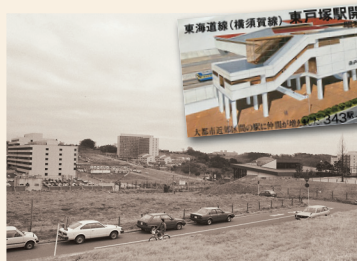
1985(昭和60)年の東戸塚駅前

子どもの頃、この辺りは田んぼばかりだったからよくたこ揚げをしたよ。辺り一面、畑、田んぼ、畑、田んぼ。よく釣りもしたね。川上川でフナやウナギが釣れたんだ。ウナギは家に持って帰って大きなたろの中に入れて泥を抜いてね。おいしかったよ。当時取り損ねた、見たこともないくらい太い、立派なウナギのことは今でも思い出すなあ。私が通っていた川上小学校は、現在の場所(秋葉町)ではなくて、柏尾町の山崎製パン横浜第一工場の近くにあったね。本校のほか北部分校、南部分校もあって、当時はずっと学区も広がったから、子どもたちは平戸や舞岡なんかから山を越えて学校に通っていましたね。