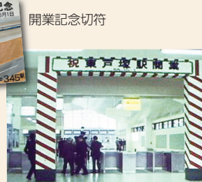
開業直後の東戸塚駅改札