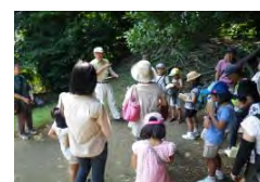
【集まれ！とつかウナシー隊】