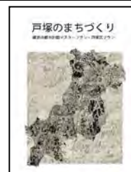
【戸塚区プラン・戸塚のまちづくり】