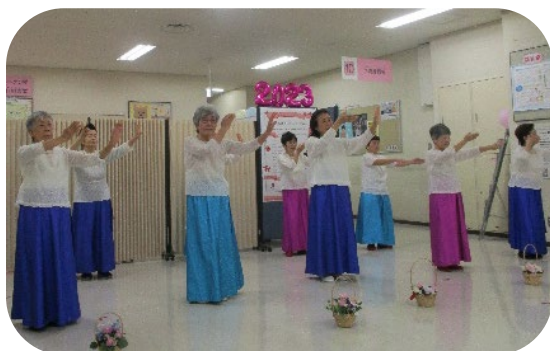
「鶴見人ネットフェスタ」