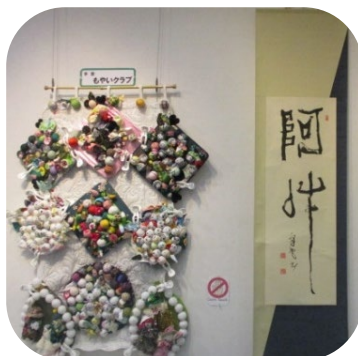
市民活動紹介展「鶴魅力」