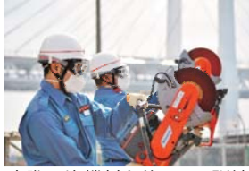
実際に資機材を使っでの訓練

鶴見消防団では、こうした大規模な災害にも対応できるよう、あらゆる災害に対応するための訓練を行っています。そして、その成果を発表する場として、11月には総本山総持寺で「鶴見消防団大規模災害対応訓練会」を開催予定です。消防団に興味のある人、入ってみたいと考えている人は、消防団係までお問合せください。