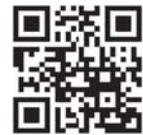
※Twitterで最新情報やお家でできる運動など発信しています

鶴見スポーツセンターは、新型コロナウイルスワクチンの集団接種会場として使用されるため、全館利用を休止していましたが、令和3年10月1日(金)より利用を再開します。詳細が決まり次第、ホームページでお知らせします。