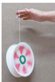
紙皿に絵を描いて自分だけのヨーヨーを作ってお遊べます