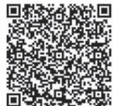
ホームページはこちら