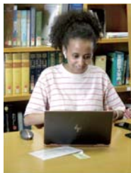
講師はさまざまな国の留学生が担当します