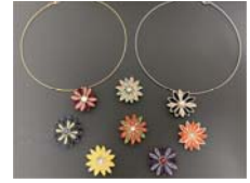
秋の装いに映える和風のアクセサリ「刺菊(けんぎく)のチョーカー」を作ります。色違いのキットの持ち帰りができます

④つまみ細工アクセサリ ⑤10月29日(金) 10時～13時 成人 先6人 1,600円 ⑥9月29日9時30分から 窓