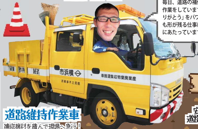
道路維持作業車 補修機材を積んで現場へ急行!

毎日、道路の補修や木の剪定などの作業をしています。皆さんからの「ありがとう」をパワーに、小さなものでも形が残る仕事に誇りを持って整備にあたっています!