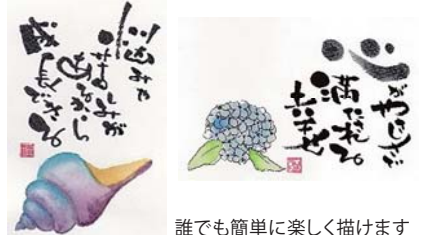
誰でも簡単に楽しく描けます