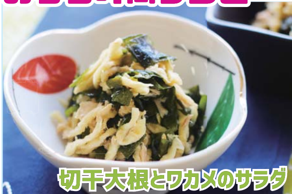
切干大根とワカメのサラダ