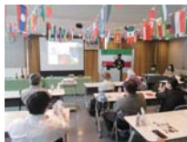
5月に開催したイラン文化講座