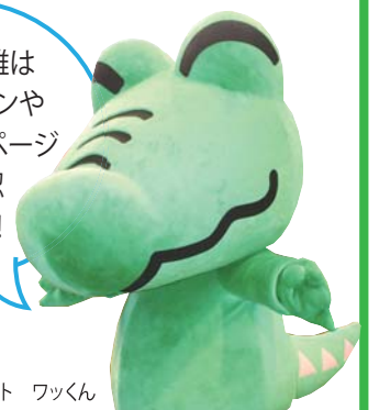
鶴見区のマスコット ワックン