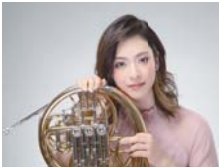
多彩で美しいホルンの音色をお楽しみください

①「わんぱく★ランド2022」人気声優による「スクリーン人形劇」▶みんなが知ってる昔ばなしをその場でアテレコ 📅6月18日(土) ①13時～13時50分 ②15時～15時50分 先250人 ¥全席指定1,000円(小学生以下500円) 申4月12日10時から 窓(☎は14時から) ②サルビア・プレミアムクラシックオーケストラの首席 vol.4 坂東 裕香 ホルンリサイタル▶神奈川フィル首席奏者によるコンサート。ホルンソロのほか、ソプラノ、バイオリンとのアンサンブル曲も楽しめます 📅7月2日(土) 14時～16時 小学生以上 先100人 ¥全席指定 一般:3,500円、区民・18歳以下・65歳以上・障害者(要証明書):3,200円 申4月16日10時から 窓(☎は14時から)