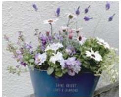
お庭や玄関などを華やかに彩ります

①春の寄せ植え 📅4月28日(木)10時30分～12時 成人 先10人 ¥2,000円 持持ち帰り用袋 申4月12日9時30分から 窓 ②母の日のアレンジメント 📅5月8日(日)10時30分～12時 小学生 先8人 ¥800円 持持ち帰り用袋 申4月12日9時30分から 窓