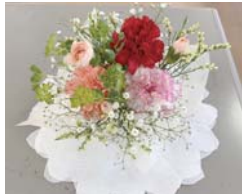
日頃の感謝をこめてプレゼントにどうぞ

③筋力バランストレーニング▶凝り固まった身体をほぐしながら、体幹を鍛え、筋肉をバランスよくつけていきましょう 📅5月13日・20日・27日 金曜日 全3回 9時30分～10時30分 成人 先15人 ¥1,500円 持飲み物、ヨガマット、タオル 申4月12日9時30分から 窓 ④矢向パソコン相談 📅5月11日(水)13時30分～16時 成人 先10人(1人30分) 持持参できればパソコン 申4月12日9時30分から 窓 ⑤絵本とわらべうたであそぼ!▶ボランティアおはなしサークル「絵本とともだち」による楽しい読み聞かせ 📅4月20日(水)10時30分～11時 未就学児と保護者 先10組 窓 ⑥矢向子育て相談 毎週木曜日※祝日は除く 10時～12時 未就学児と保護者 先各10組(1組1時間程度) 窓 ⑦なるほど!てっとう教室▶子ども鉄道教室、クイズ大会など。南武線をもっと知ろう! 📅5月3日(火・祝)10時～15時 先80人 窓