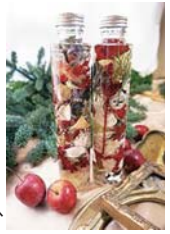
植物を気軽にインテリアへ ※写真はイメージです