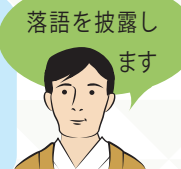
落語を披露し ます