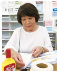
修理の様子も見学できるので、「ものを大切に する気持ち」も育ちます

背表紙がとれてしまった絵本、動かなくなった電車のおもちゃ...そんなお気に入りの本やおもちゃはありませんか?専門知識をもったボランティアが、専用の材料や器具で修理します(原則当日返却)。