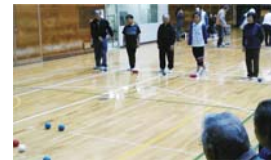
老若男女 誰でも楽しめます

㊟11月10日(土)9時～12時(受付は8時45分～9時) ㊠鶴見スポーツセンター(元宮2-5-1) ㊡区在住・在勤・在学の小学生以上 ㊢25組(1組5人まで) ㊣¥1人100円 ㊤10月11日9時から専用申込書(鶴見スポーツセンター、区内地域ケアプラザで配布)を ㊦か ㊧ ㊨鶴見区さわやかスポーツ普及委員会(元宮2-5-1鶴見スポーツセンター内) ㊩080-4654-5028 ㊪580-3037