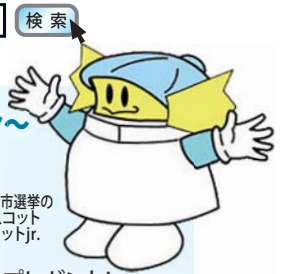
横浜市選挙のマスコットイコットjr.