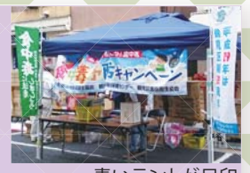
青いテントが目印

📍 ベルロードつるみ(鶴見銀座商店街・京急鶴見東口)「つるぎんドット来~い!!」