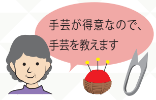
手芸が得意なので、 手芸を教えます

つるみ区民活動センターでは、イベントを盛り上げる演奏者やパフォーマー、学習会や講座の講師のボランティアを鶴見区で活動している団体に紹介しています。