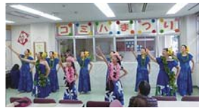
ダンスの発表も見られます