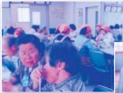
▲ 渋沢ふれあい会食の会