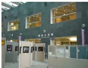
総合庁舎内公会堂入口